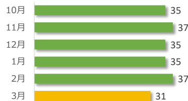
医療事故報告件数の推移（直近 6 か月）

3 月は事故発生の報告が 31 件ありました。 病院・診療所別では、病院からの報告が 30 件、診療所からの報告が 1 件でした。