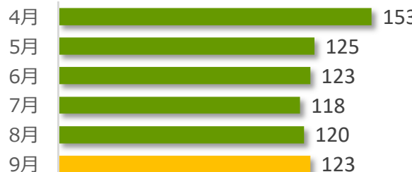
相談件数の推移（直近6か月）

9月の相談件数は123件で、相談者の内訳は医療機関が61件、遺族等が59件、その他・不明が3件でした。遺族等の求めに応じて相談内容をセンターが医療機関へ伝達したものは1件（累計145件）でした。医療機関から医療事故の判断について相談を受け、センター合議を開催し、医療機関へ助言したものは5件（累計421件）でした。