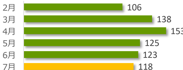
相談件数の推移（直近 6 か月）

7 月の相談件数は 118 件で、相談者の内訳は医療機関が 65 件、遺族等が 47 件、その他・不明が 6 件でした。遺族等の求めに応じて相談内容をセンターが医療機関へ伝達したものは 1 件（累計 142 件）でした。医療機関から医療事故の判断について相談を受け、センター合議を開催し、医療機関へ助言したものは 3 件（累計 415 件）でした。