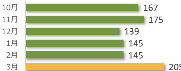
相談件数の推移（直近 6 か月）

3 月の相談件数は 205 件で、相談者の内訳は医療機関が 85 件、遺族等が 107 件、その他・不明が 13 件でした。 遺族等の求めに応じて相談内容をセンターが医療機関へ伝 達したものは 1 件（累計 160 件）でした。 医療機関から医療事故の判断について相談を受け、センター 合議を開催し、医療機関へ助言したものは 5 件（累計 449 件）でした。