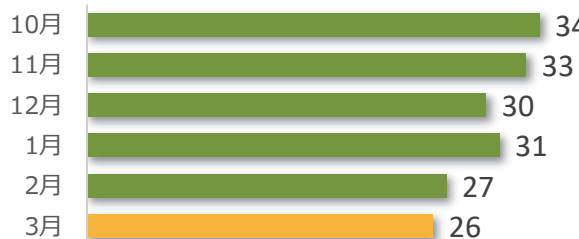
医療事故報告件数の推移（直近 6 か月）

3 月は事故発生の報告が 26 件ありました。 病院・診療所別では、全て病院からの報告でした。