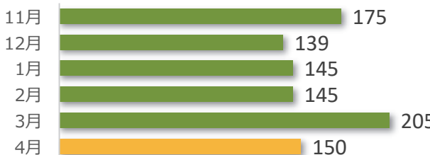
相談件数の推移（直近 6 か月）

4 月の相談件数は 150 件で、相談者の内訳は医療機関が 72 件、遺族等が 70 件、その他・不明が 8 件でした。 遺族等の求めに応じて相談内容をセンターが医療機関へ伝達したものは 4 件（累計 164 件）でした。 医療機関から医療事故の判断について相談を受け、センター合議を開催し、医療機関へ助言したものは 8 件（累計 457 件）でした。