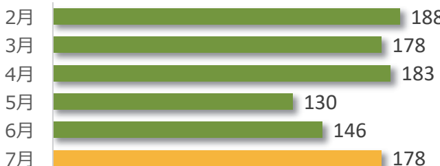
相談件数の推移 (直近6か月)

7月の相談件数は178件で、相談者の内訳は医療機関が83件、遺族等が89件、その他・不明が6件でした。 遺族等の求めに応じて相談内容をセンターが医療機関へ伝達したものは0件 (累計 193件) でした。 医療機関から医療事故の判断について相談を受け、センター合議を開催し、医療機関へ助言したものは4件 (累計 549件) でした。